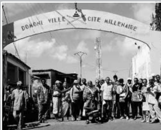
Un peu de tourisme entre deux relevés ou entre deux conférences. Prochaine étape : la restauration de ces sites surprenants.