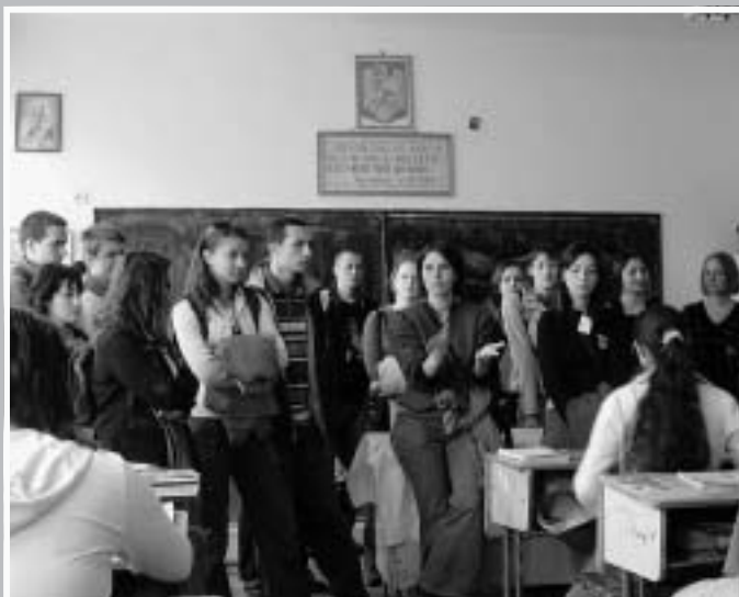
A Iasi, les architectes ont fait des relevés des grands ensembles datant de l'ère communiste et rencontré des écoliers.

relle swahili. « Ils voyaient ce patrimoine se dégrader et cherchaient à alerter l'Unesco », raconte Pierre Blandin qui a apporté son aide au Collectif pour monter un dossier de demande de classement. Une procédure très longue qui a débuté en 2004 et qui concerne précisément la capitale de l'Anjouan (l'une des quatre îles des Comores) : Mutsamudu.