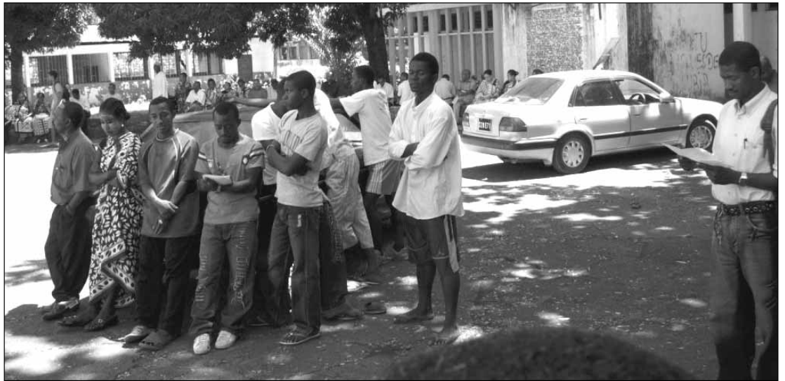
Tableau Résultats du Premier groupe baccalauréat