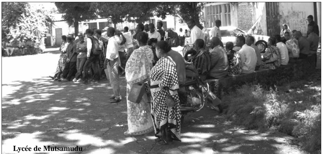
Lycée de Mutsamudu

Lire page 4 ainsi que la liste des admis au premier groupe à Ndzuwani