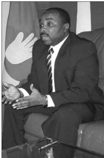
(A propos de menace de déstabilisation à partir de Maore)

Je compte entrer en contact avec les autorités de cette île dans le cadre de la coopération décentralisée pour voir ensemble ce que nous pouvons faire en matière d'économie et de sceller concrètement la cause du mouvement massif des frères des autres îles vers Mayotte. Je sais qu'il y a le lien de sang et le travail. Il semble que la plupart des Anjouanais, se rendant à Mayotte, travaillent dans l'agriculture. Dans le cadre de la coopération décentralisée, nous pouvons organiser le circuit de sorte, par exemple, qu'ils cultivent ici pour vendre la production là-bas. Mais il faut ouvrir un service phytosanitaire agréé par