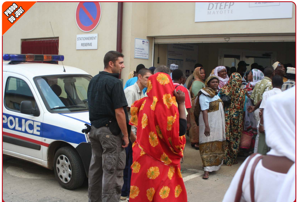
Les mamans commerçantes étaient venues très nombreuses pour assister à une réunion d'information concernant le code de la consommation. Malheureusement, les événements ont voulu qu'il en soit autrement.

Suite à la réunion organisée à l'initiative de la préfecture le mercredi 12 septembre à l'attention de l'ensemble des élus, des affiches individualisées ont été remises aux 17 maires de l'île. Ces affiches vont être apposées dans les lieux publics dans chaque commune. Ces documents