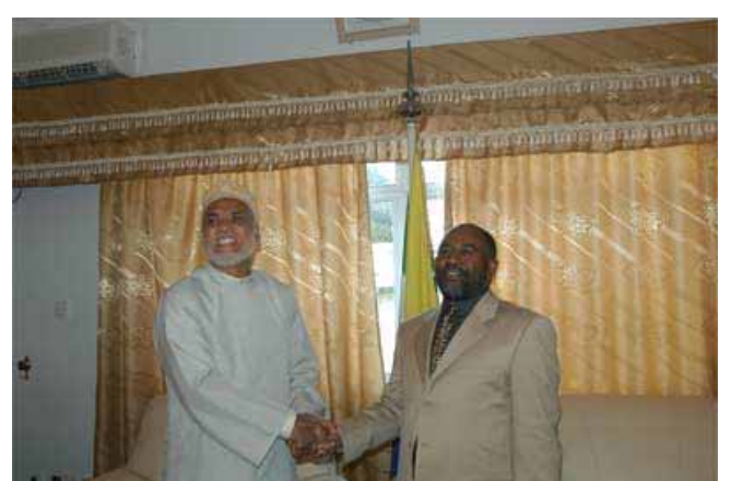
Poignée de main démocratique entre l'ancien et le nouveau Président.

Onze ans après le passage de relais entre Djohar et Taki, les Comores ont vécu vendredi, la deuxième alternance démocratique de son histoire.