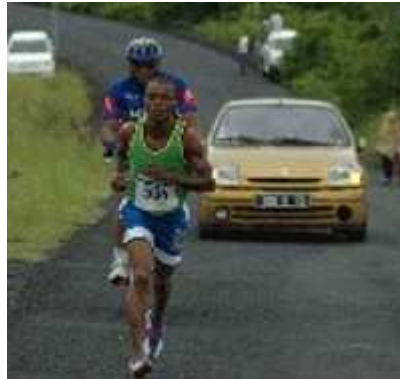
Un coureur sur les routes de Grande-Comore

http://www.marathons.fr/spip.php?article5596